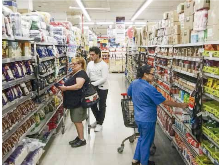
En rojo. En valores corrientes, todos los canales evidenciaron subas por debajo de la inflación.

En el caso de los supermercados, el descenso real del 3,1% interanual se da en un contexto donde algunos rubros muestran fuertes aumentos nominales, como carnes (+46,9%) y frutas y verduras (+37%). El comportamiento de los medios de pago marca una tendencia clara: las tarjetas de crédito concentraron el 43,6% de