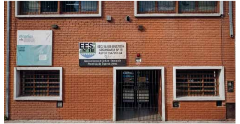
En “Mardel”. La Escuela Secundaria N° 18 “Astor Piazzolla”.

Identificaron a un alumno que llamó a la escuela para hacer una amenaza. La familia deberá pagar los costos del operativo.