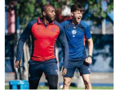
El Ciclón necesita sumar de a tres.

Platense recibe a San Lorenzo en un duelo crucial