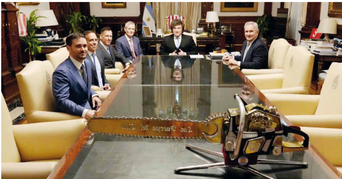
■ Encuentro con Peter Thiel. "Fue una reunión maravillosa. Es un anarcocapitalista, entonces está muy interesado en cómo es ser Presidente siendo anarcocapitalista".