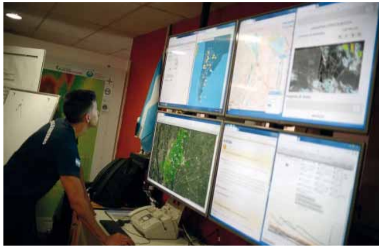
De paro. De 5 a 12 el SMN dejará de difundir pronósticos, avisos y reportes oficiales.

todo en las partidas programadas durante la mañana, mientras que los arribos no reprogramados deberán ser atendidos por razones de seguridad operativa.