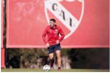
El Rojo llega en un buen momento.

Independiente buscará tres puntos claves ante Riestra