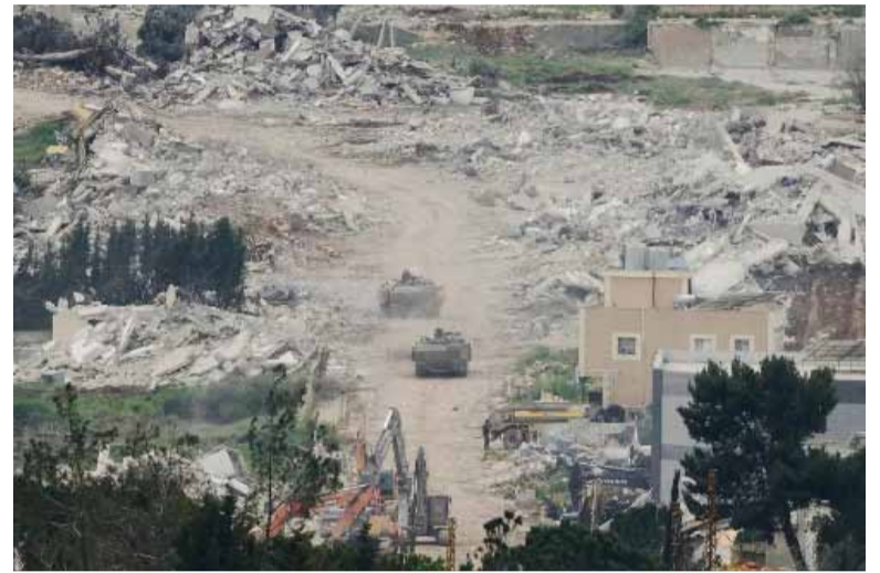
Sin tregua. En el sur del Líbano, al menos tres personas murieron en bombardeos atribuidos al Ejército israelí.

Mientras tanto, la violencia persiste en otros frentes de la región. En el sur del Líbano, al menos tres personas murieron en