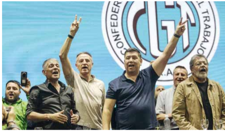
En otra dirección. La Justicia había hecho lugar a un planteo de la CGT.

El recurso fue concedido el 7 de abril "en relación y con efecto devolutivo", lo que implicaba que la cautelar seguía vigente durante la tramitación de la apelación. Frente a ese encuadre, el Estado se presentó en queja para que se modificara el efecto del recurso y se le otorgara